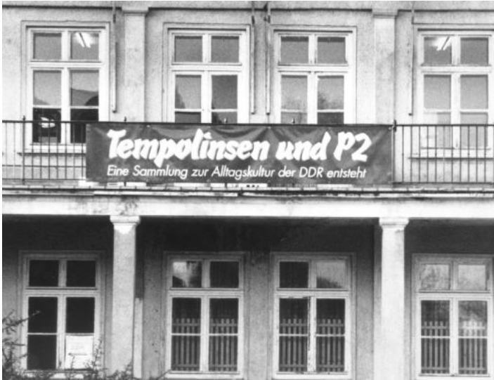
Abb. 1 Provisorische Ko- Nutzung mit einer Kindereinrichtung im Wohnkomplex II (1953/54) in Eisen- hüttenstadt für die Ausstellung „Tempo- linsen und P 2“, 1995.

aufzuwarten, war schlechterdings unangebracht – und angesichts der zum damaligen Zeitpunkt noch ausstehenden Forschungen zur Gesellschaftsgeschichte der DDR auch gar nicht möglich. 9