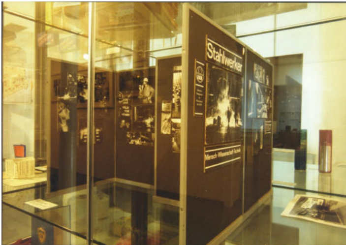
Abb. 6 Ausstellungsin- stallation zum Thema Industrieentwicklung in Ostbrandenburg. Das Bild zeigt ein Aus- stellungsmodell für das Eisenhüttenkombinat Ost aus den 1980er- Jahren.

konkretisiert, die Eisen- und Stahlindustrie EKO/Eisenhüttenstadt, für das Chemieprogramm der DDR das PCK/Schwedt und das Textilkombinat Guben sowie für die Entwicklung der Mikroelektronik das Halbleiterwerk Frankfurt/Oder. In einem weiteren Abschnitt wurden ein Dienstleistungskombinat und ein privater Handwerksbetrieb exemplarisch für die unter den großen Kombinatn liegende Ebene gezeigt. Aus dem System der Zentralplanwirtschaft resultierte unter anderem eine kampagnenförmig organisierte Produktion von Konsumgütern, die in der Ausstellung anhand des „Chemieprogramms“ der späten 1950er- und frühen 1960er-Jahre sowie der sogenannten „Konsumgüterproduktion“ der 1970er- und 1980er-Jahre dargestellt wurde.