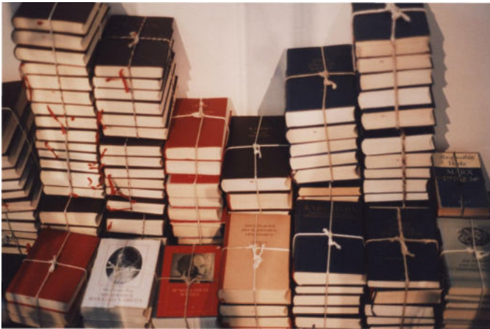
Abb. 2 Ausstellungsin- stallation für den Raum „Massenprodukte – Produktmassen“ in der Ausstellung „Tempolin- sen und P 2“. Das Bild zeigt die „Klassiker des Marxismus-Leninismus“ als Dingausstat- tung.

Ein weiterer Raum widmete sich unter dem Titel „Massenproduktion“ zwei unterschiedlichen Objekttypen. Auf der einen Seite waren „Produktmassen“, eine Massensammlung alltagskultureller Objekte in Form von Kunststoffutensilien aus dem Haushalt, zu sehen, auf der anderen Objekte der politischen Massenproduktion – Auszeichnungsmappen und Ausgaben der ‚Klassiker‘ von Marx/Engels, Lenin und Stalin. Hier ging es also nicht um Einzelobjekte, sondern um gesellschaftsspezifische Dingausstattungen in der DDR.