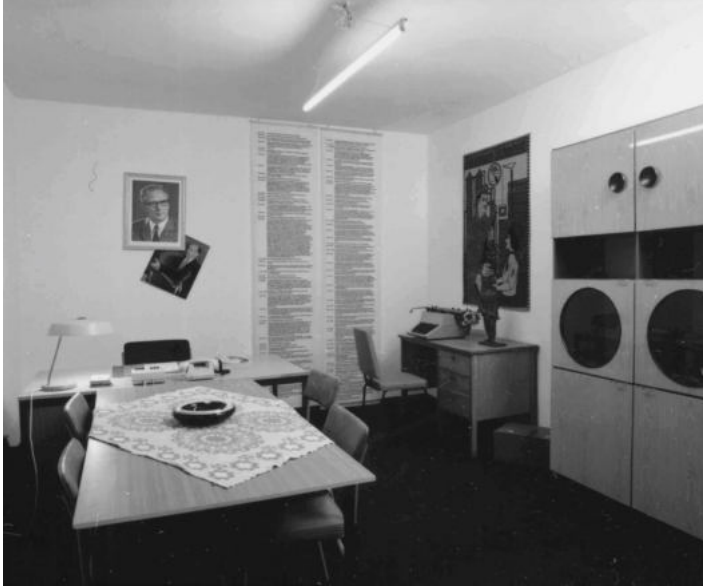
Abb. 3 Arrangement eines Funktionärsbüros in der Ausstellung „Tempolinsen und P 2“.

genstände auf den behelfsmäßigen Charakter von Büroausstattungen in der DDR sowie die Nutzung des Mobiliars verweisen. Diese Mischung aus ‚autoritärem‘ Raumensemble, Schrankwand, Akten, Zierrat und Tischdecke provozierte ob ihrer realitätsnahen Inszenierung teils heftige Reaktionen beim Publikum.