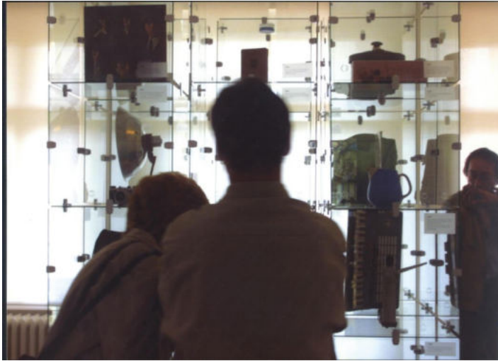
Abb. 5 Objektzusammenstellung in dem die Chronologie diskutierenden Ausstellungsraum „40 Jahre DDR – 40 Objekte“.

unter dem Titel „Ein Ereignis als prägende Erfahrung?“ mit den Weltjugendfestspielen von 1973, die von Zeitgenossen vielfach als generationsprägend und als früher Impuls für die Friedliche Revolution von 1989 interpretiert wurden. Das Ausstellungssegment fand mit einer Fotogalerie einen Abschluss, die Fotos von Jugendlichen in den 1950er- und in den 1980er-Jahren gegenüberstellte.