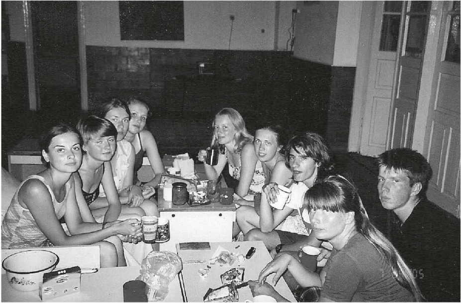
Abb. 1: Kollektiv einer ethnografischen Expedition in albanischen Dörfern der Ukraine nach dem Abendessen im provisorischen Expeditionsquartier. Studierende der Staatlichen Universität St. Petersburg und wissenschaftliche Mitarbeiter des MAE (Kunstkammer). Dorf Georgiivka, Gebiet von Zaporozhje, Ukraine, 2005.

bensstrategien« und die Organisation des Alltags unter Expeditionsbedingungen, über verschiedenartige kommunikative Fertigkeiten. Letztere werden unter Bedingungen eines geschlossenen Kollektivs psychologisch immer zu einer Herausforderung. TeilnehmerInnen einer Expedition sind üblicherweise alle zusammen in einem Expeditionsquartier untergebracht (ein leerstehendes Haus im Dorf, eine Schule, ein Kindergarten oder Club) und müssen den Alltag mit seinen physischen und psychischen Abläufen miteinander teilen: Essenspräferenzen oder -abneigungen anderer KollegInnen sind zu berücksichtigen und umgekehrt die persönlichen Präferenzen an das Kollektiv anzupassen.