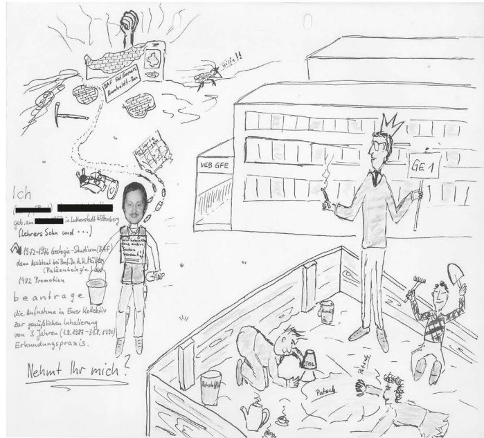
Abb. 3: »Antrag« zur Aufnahme in die Brigade von Jürgen Lorenz.

erzählen sie von den Ansprüchen, die erfüllt werden mussten. 15 Brigadetagebücher sind ein Zeugnis für das Arrangieren mit den Anforderungen des »sozialistischen Wettbewerbs«. Jedenfalls wird beim Blättern in Brigadebüchern schnell deutlich, wenn die Verantwortlichen des Buches lediglich das Nötigste taten, um den Anforderungen zu genügen. Hier sind Berichte knapp verfasst, es finden sich kaum illustrative Elemente und häufig werden mehrere Wettbewerbsjahre in einem Band zusammengefasst. Diese Exemplare sind Ausdruck bloßer Pflichterfüllung. Selbstverständlich gibt es auch sehr viele Bücher, die den Eindruck vermitteln, dass sich eine oder mehrere Personen sehr um sie bemühten. Hier liegt oft eine abwechslungsreichere Themenwahl vor, es sind Programmhefte als Andenken an Kultur- oder Freizeitveranstaltungen eingeklebt und Berichte ausführlicher verfasst. In diesen Büchern finden sich viele Beiträge zu gemein-