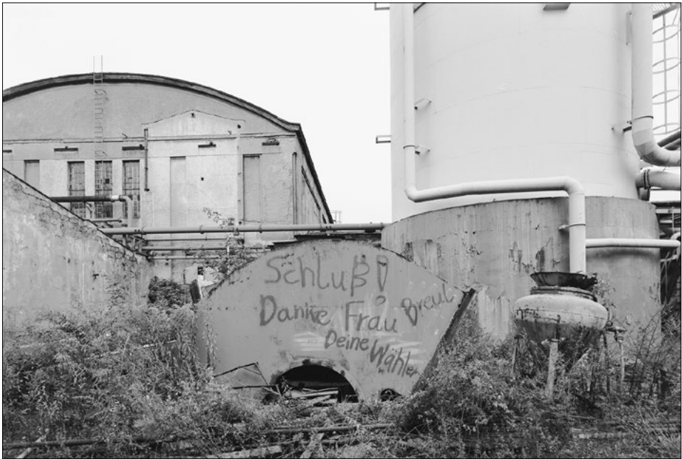
Abb. 2 An Birgit Breuel (Präsidentin der Treuhandanstalt) adressierter Schriftzug auf dem Gelände der stillgelegten Sächsischen Kunstseiden GmbH Pirna, 1995.

Schreiben, die an öffentliche Institutionen, an Amts- und Autoritätspersonen gerichtet werden, um Missstände anzuprangern und Veränderungen zu bewirken, haben eine lange historische Tradition. Auch in der DDR war das Recht, sich mit „Vorschlägen, Hinweisen, Anliegen oder Beschwerden an die Volksvertretungen, ihre Abgeordneten oder die staatlichen und wirtschaftlichen Organe“ zu wenden, in der Verfassung verankert. Diese Option wurde rege genutzt – rein rechnerisch wandte sich jeder DDR-Haushalt mindestens einmal mit einem Beschwerdebriefe an Verwaltungen, Medien, staatliche Institutionen oder gesellschaftliche Organisationen. Das Spektrum der Belange ist breit, da nahezu alle Bereiche des öffentlichen Lebens staatlich verwaltet wurden. In Dresden beispielsweise bezogen sich die Eingaben vor allem auf Wohnungsprobleme (die Beschaffung, Ausstattung und die Zuteilungszeiträume), auf Versorgungsengpässe oder mangelhafte Qualität von Waren – auch Nahrungs- und insbesondere Genussmittel. 15